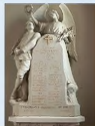
Monument aux Morts À l'intérieur de l'Eglise

A l'issue de la cérémonie un apéritif sera offert.