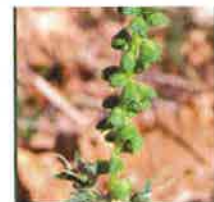
Fleurs mâles sur de longs épis