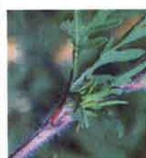
Tige velue et rougeâtre