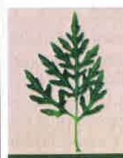
Feuille profondément découpée