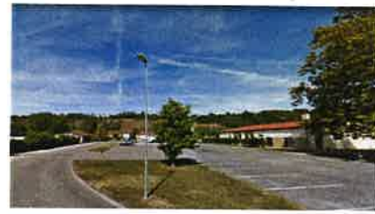
Stationnement extérieur environ 120 places