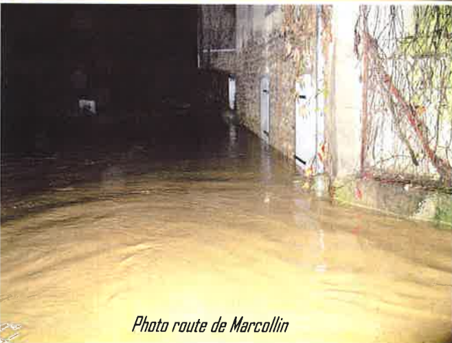
Photo route de Marcollin