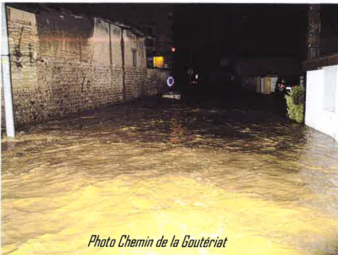
Photo Chemin de la Goutériat

Merci par avance à toutes les bonnes volontés.